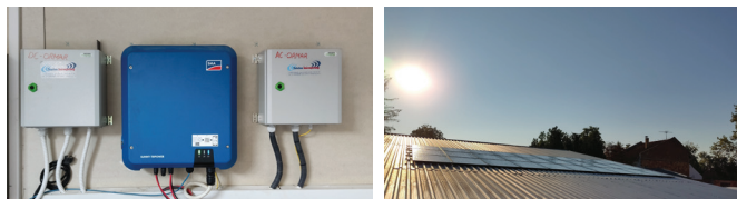
12.3 kWp Leapton PV panel and SMA Tripower 10kW inverter

Sa našim sistemom ključ u ruke, možete minimizirati svoje račune za struju i grejanje! A mi kulcsrakész rendszerünkkel minimalizálhatja villany és fűtés számláját!